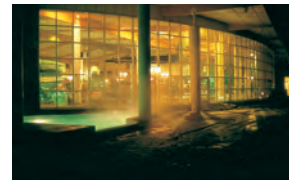
Rosenlundsbadet. Med en 50 meters sportbassäng, separat hoppbassäng och äventyrsbad är Rosenlundsbadet en av Sveriges bästa badanläggningar.